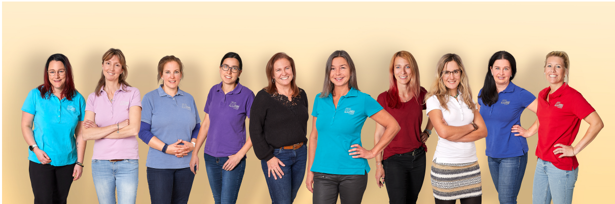
Teamfoto MPT Liezen