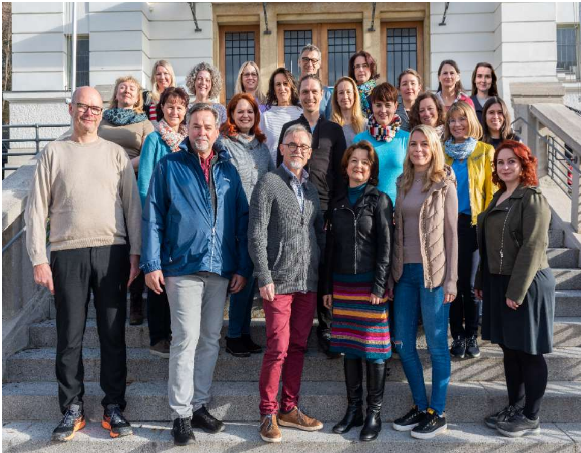
Teamfoto MPT Graz/Graz-Umgebung