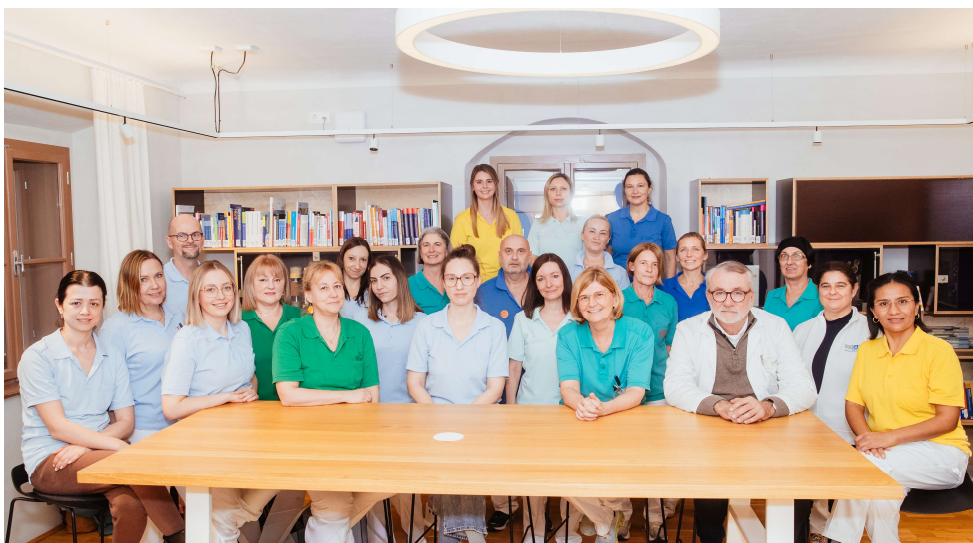
Teamfoto Albert Schweitzer Hospiz und Tageshospiz der GGZ

In den Geriatrischen Gesundheitszentren der Stadt Graz befinden sich das Albert Schweitzer Hospiz mit 14 Betten und das Tageshospiz mit 6 Plätzen.