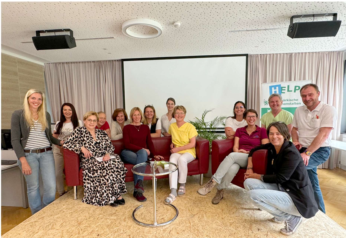
Teamfoto MKPT Leoben