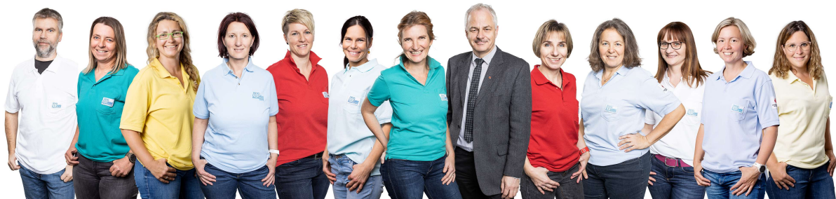
Teamfoto MPT Hartberg/Weiz/Vorau