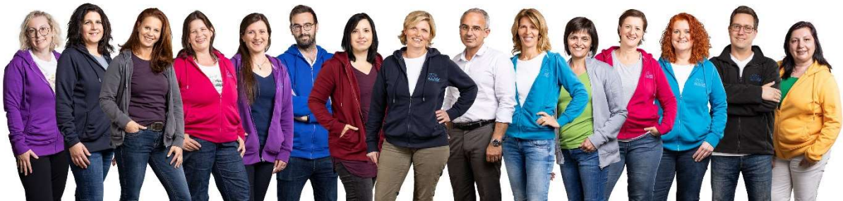
MPT Feldbach/Fürstenfeld