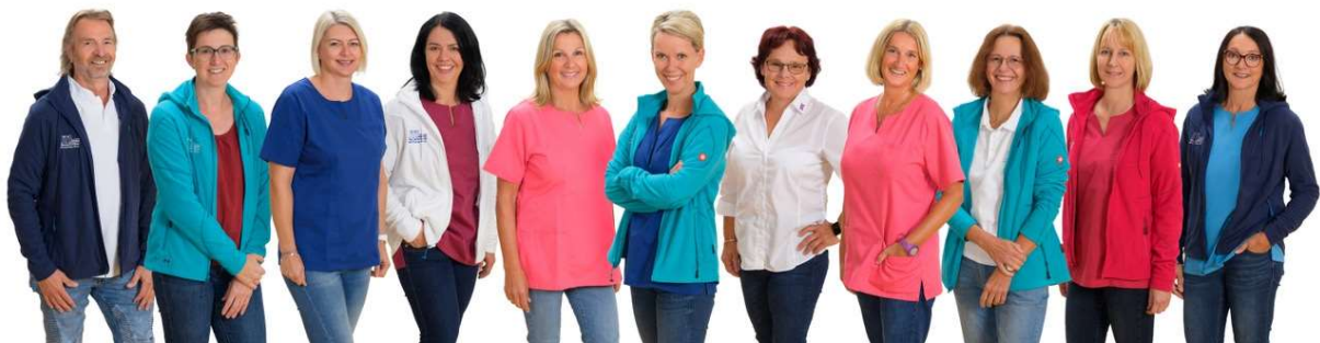
Teamfoto MPT Mürzzuschlag/Bruck