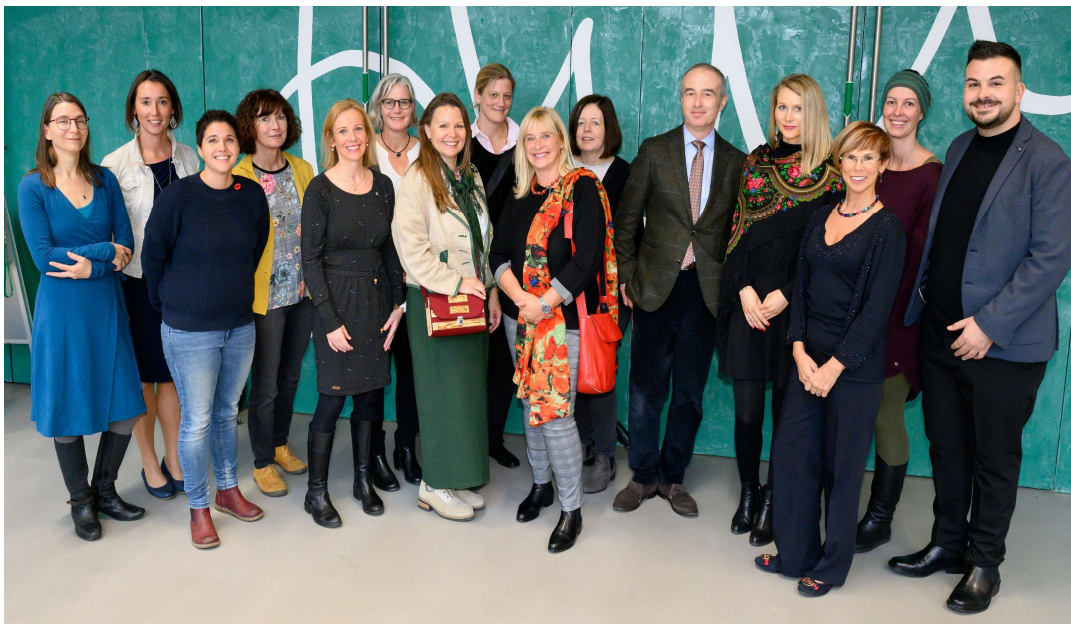
Teamfoto MKPT Graz