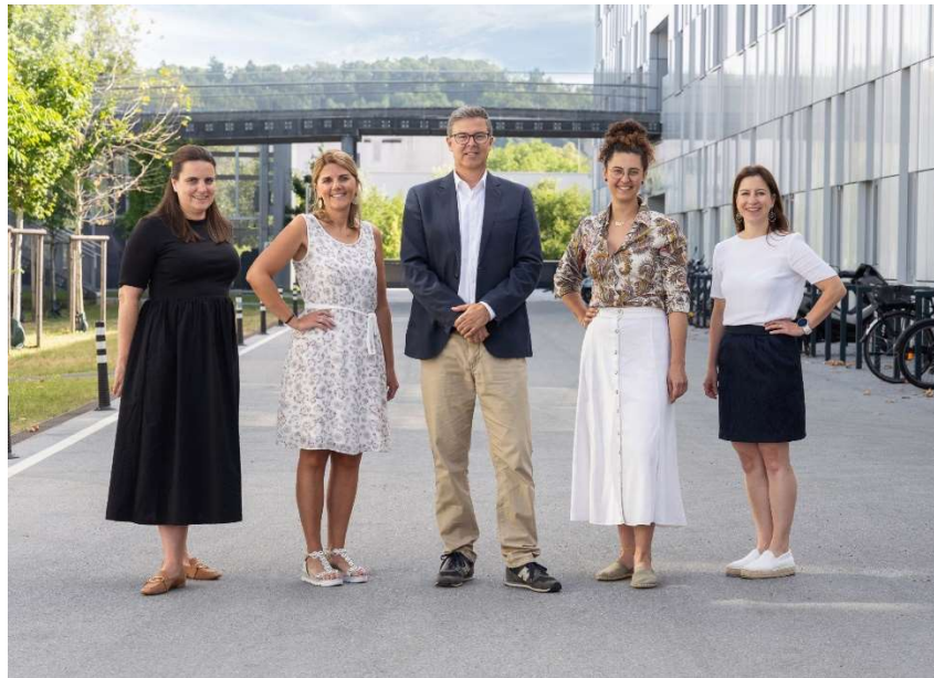
Team Koordination Hospiz- und Palliativbetreuung und integrierte Versorgung Steiermark

Die Koordination Hospiz- und Palliativbetreuung Steiermark ist die landeskoordinierende Stelle der steirischen Hospiz- und Palliativeinrichtungen. Sie wird vom Gesundheitsfonds Steiermark finanziert und ist in der Zentraldirektion der KAGES angesiedelt, die auch die Koordinationsstelle mobiREM beheimatet.