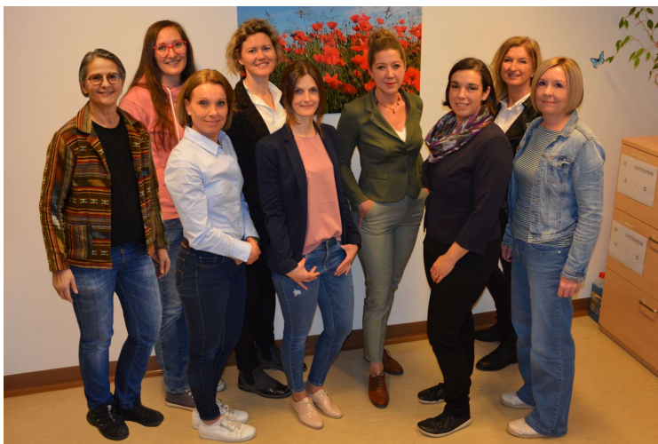
Teamfoto MPT Südsteiermark