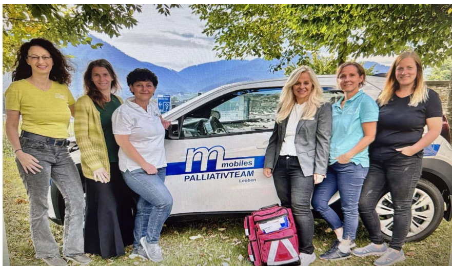
Teamfoto MPT Leoben