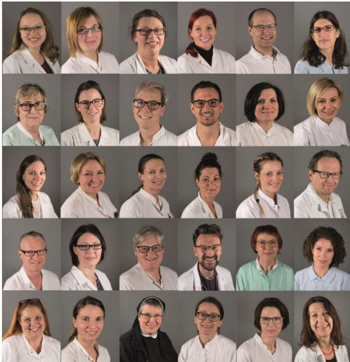
Team der Palliativstation Krankenhaus der Elisabethinen

Im Himmelshafen-Hospiz stehen zwei Betten für obdachlose Menschen zur Verfügung. Die Finanzierung dieser Einrichtung erfolgt aus Mitteln des Gesundheitsfonds Steiermark.