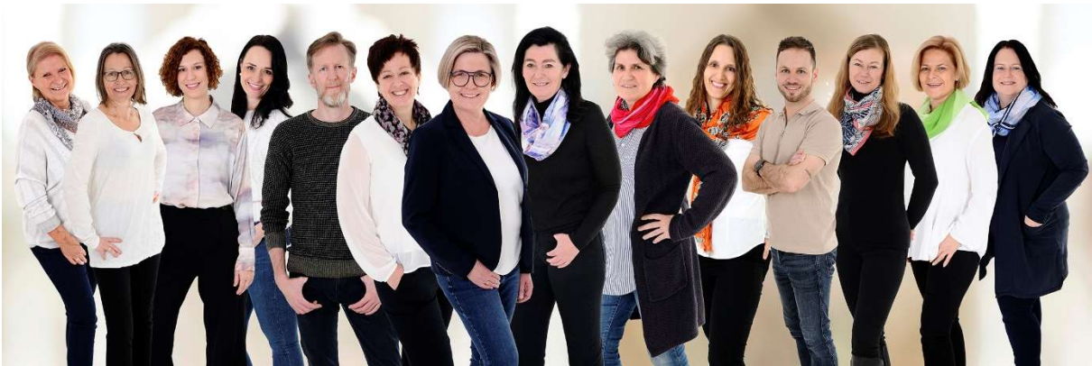
Teamfoto MPT Weststeiermark